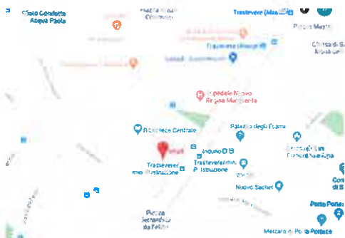
MIUR - viale Trastevere 76/a